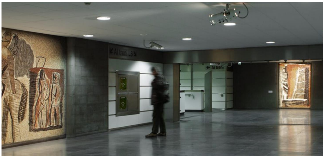
(nell'immagine, l'interno della stazione di Mostra)