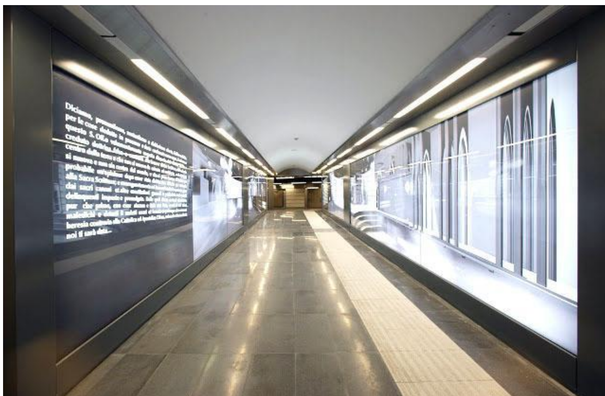
(nell'immagine, l'interno della stazione di Mergellina)

Il tracciato complessivo della linea 6 è destinato ad aumentare fino a 5,5km, coprendo le otto stazioni menzionate e generando un nodo di interscambio con la linea 1 presso Piazza Municipio. Saranno presenti anche connessioni dirette con la ferrovia Cumana e con la linea 2 metropolitana (gestita da Trenitalia). Le tre stazioni che separano Mergellina e Piazza del Municipio, a gennaio 2023 risultano in fase di realizzazione. A regime, la linea 6 potrà trasportare quasi 8.000 passeggeri per ora e per direzione, con una frequenza di circa 4,5 minuti, dando un sensibile contributo alla riduzione del traffico in superficie. L'inaugurazione è programmata per il 2023.