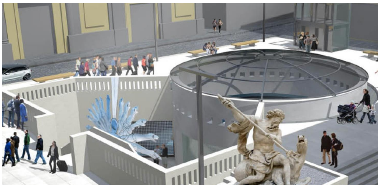
(simulazione digitale dell'aspetto definitivo della stazione di Chiaia)