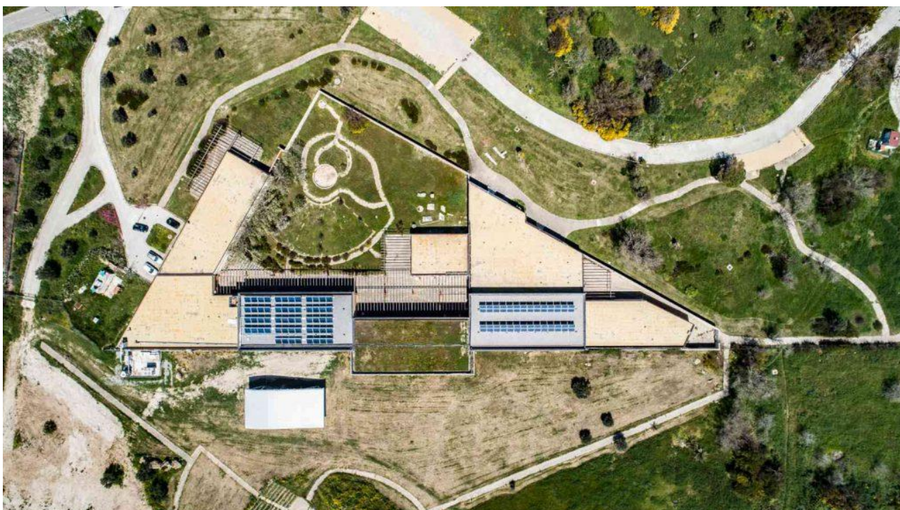
(Impianto di solar cooling, geotermico ed efficientamento energetico dei corpi illuminanti installato sopra al Museo.)